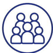
C20 (sociedade civil)