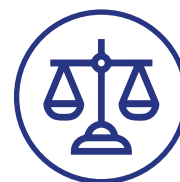
J20 (cortes supremas)