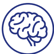
T20 (think tanks)