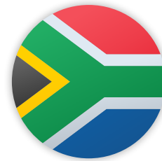
África do Sul (2025)

O país que ocupa a presidência do G20 é responsável por coordenar a agenda do grupo, sempre em contato permanente com os demais membros, de maneira a responder a questões prementes da agenda mundial. Os demais membros da troika prestam apoio ao país que está na presidência, de modo a garantir a continuidade das políticas e agendas.