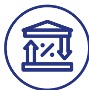
SAI20 (tribunais de contas)